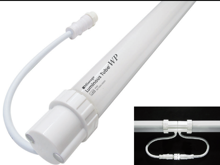
防水コネクターで連結可能